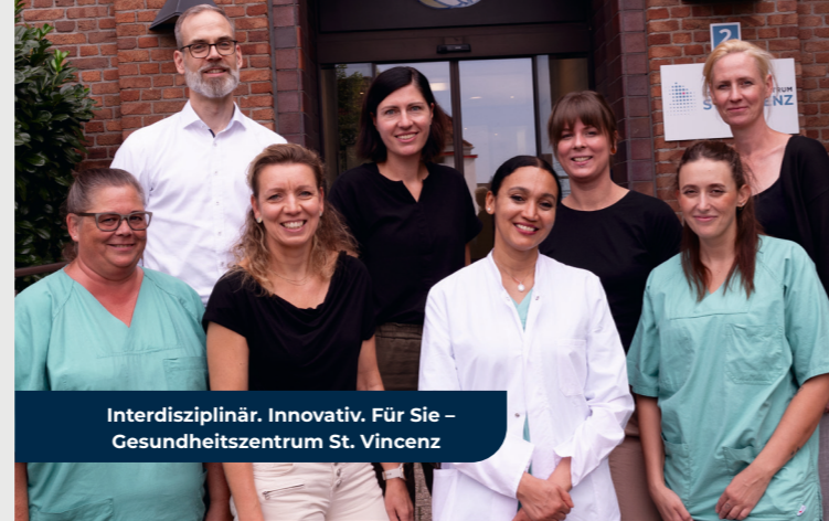
Interdisziplinär. Innovativ. Für Sie – Gesundheitszentrum St. Vincenz